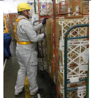
昇栄での実習の様子

11月8日から高等部の後期現場実習が始まり、31名の生徒が実習に行ってきました。1年生は「(働く場や事業所の生活を)知る実習」、2年生は「挑戦する実習」、3年生は「(自分の進路を)決める実習」と、各学年がそれぞれに目標をもち取り組みました。高等部に入って初めての実習を経験する生徒や新しい場所で実習をする生徒、前回よりも長い期間実習に取り組む生徒等それぞれが緊張感を持ちながら実習に取り組み、日頃の積み重ねが課題となることや挨拶や返事を毎日繰り返して取り組むことの大切さを確認しました。