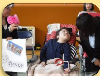
自己紹介では、名前と好きなものを紹介しました。