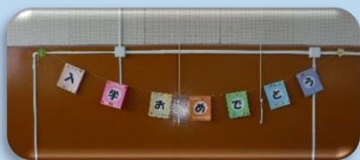
「入学おめでとう」の看板