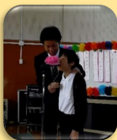
「これから歓迎会を始めます。」