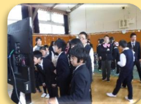
新入生に関する「どっちかな？クイズ」で大いに盛り上がりました。