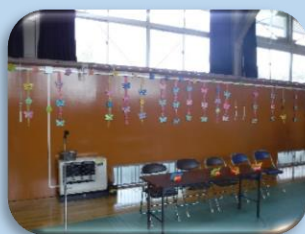
「花」や「ハート」で華やかに会場を飾りました。