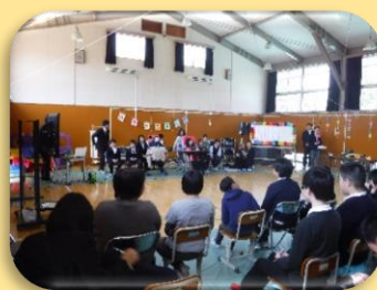
緊張する新入生を先輩たちが優しく見守ります。