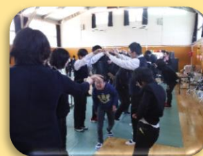
最後はゲートを作ってお見送り。