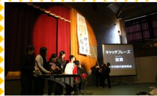
キャッチフレーズ宣言