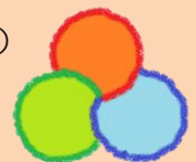
地域支援センターにしの郷