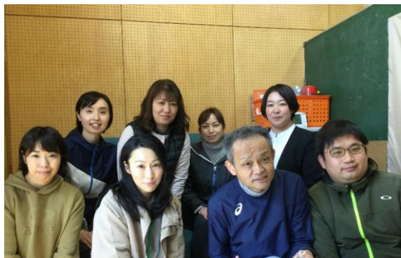
<今年度のにしの郷担当職員>