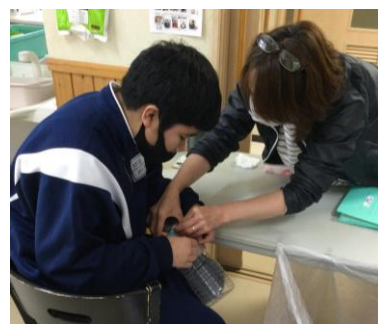
↑ ペットボトルの分別の作業