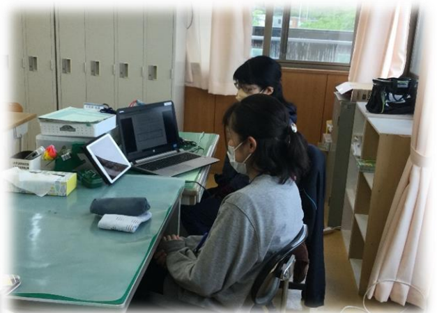
リモートによる全体会の様子