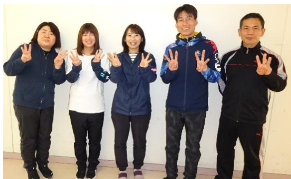
【中学部3学年ブロック】