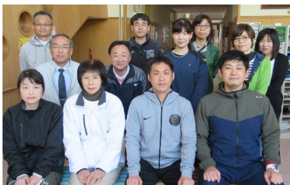
【高等部3学年ブロック】