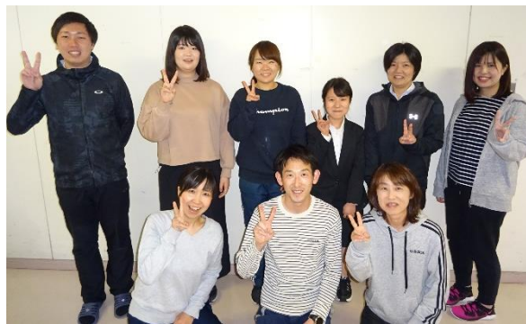
【中学部2学年ブロック】