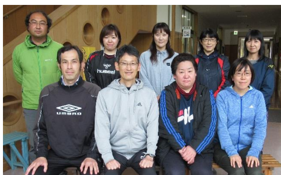
【高等部2学年ブロック】