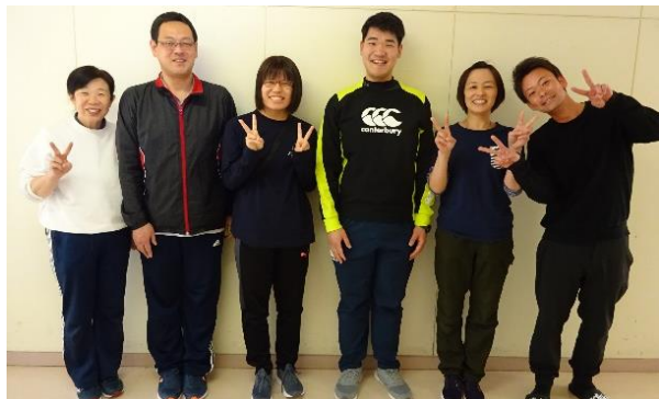
【中学部1学年ブロック】