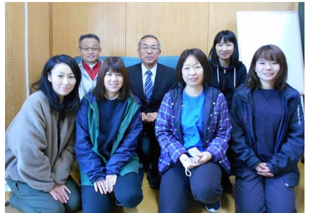
〈今年度のにしの郷担当職員〉