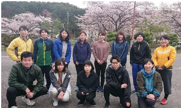
【小学部低学年ブロック】