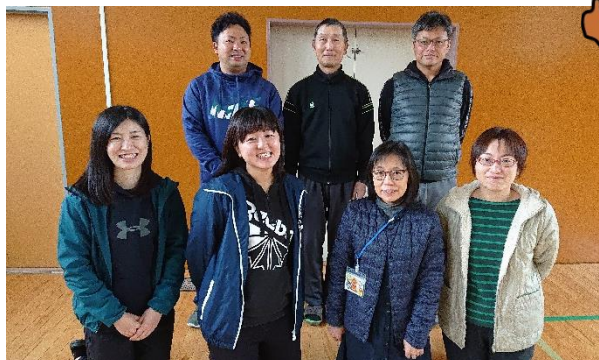
【小学部高学年ブロック】