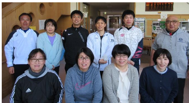
【高等部1学年ブロック】