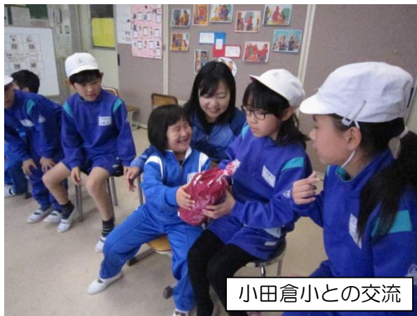
小田倉小との交流