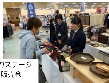
メガステージ 販売会