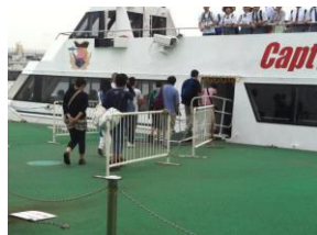
キャプテンライン (乗船)

ホテルの近くから海遊館まで船で移動しました。海遊館では8月25日にやってきたジンベイザメの「遊ちゃん」や、珍しい魚たちに興味津々。事前に調べていた見たい魚を、しおりと照らし合わせながら探し歩きました。